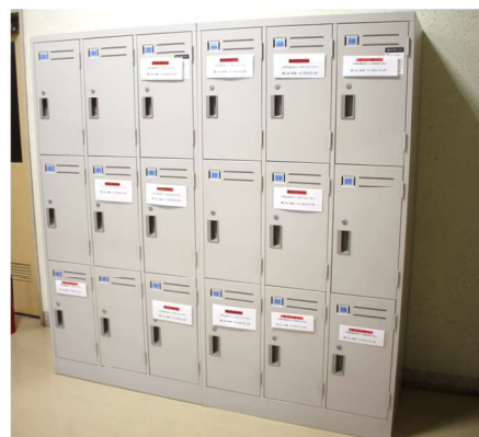
■貸出ロッカー（トレーニング室入口前） 〔レンタル料〕 1,000円/6ヶ月 ※貸出は、18歳以上の会員の方のみ