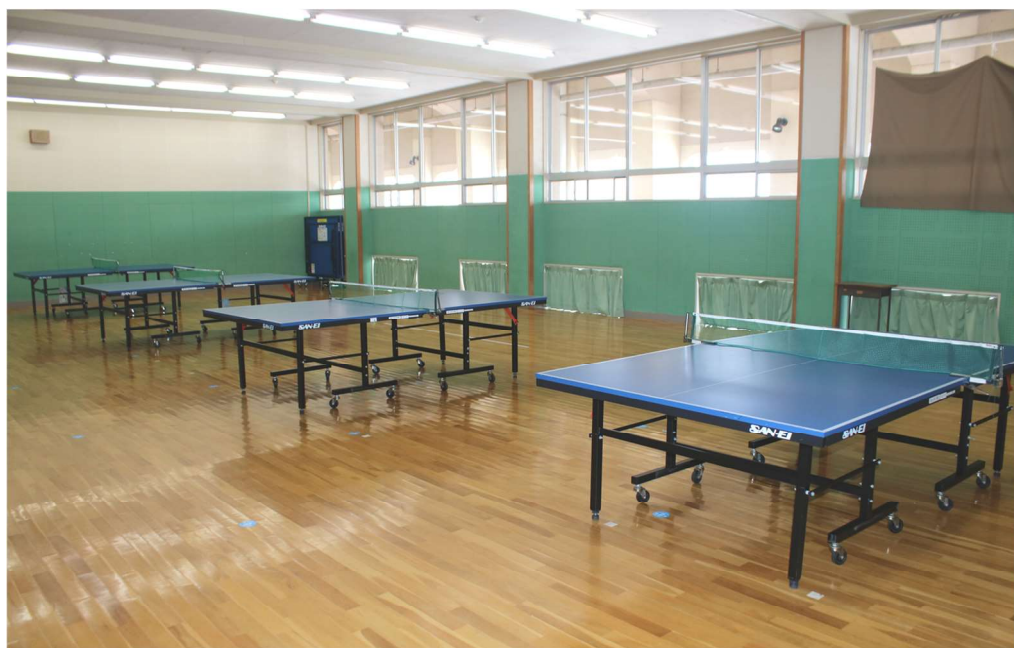
■卓球場（多目的ホール）