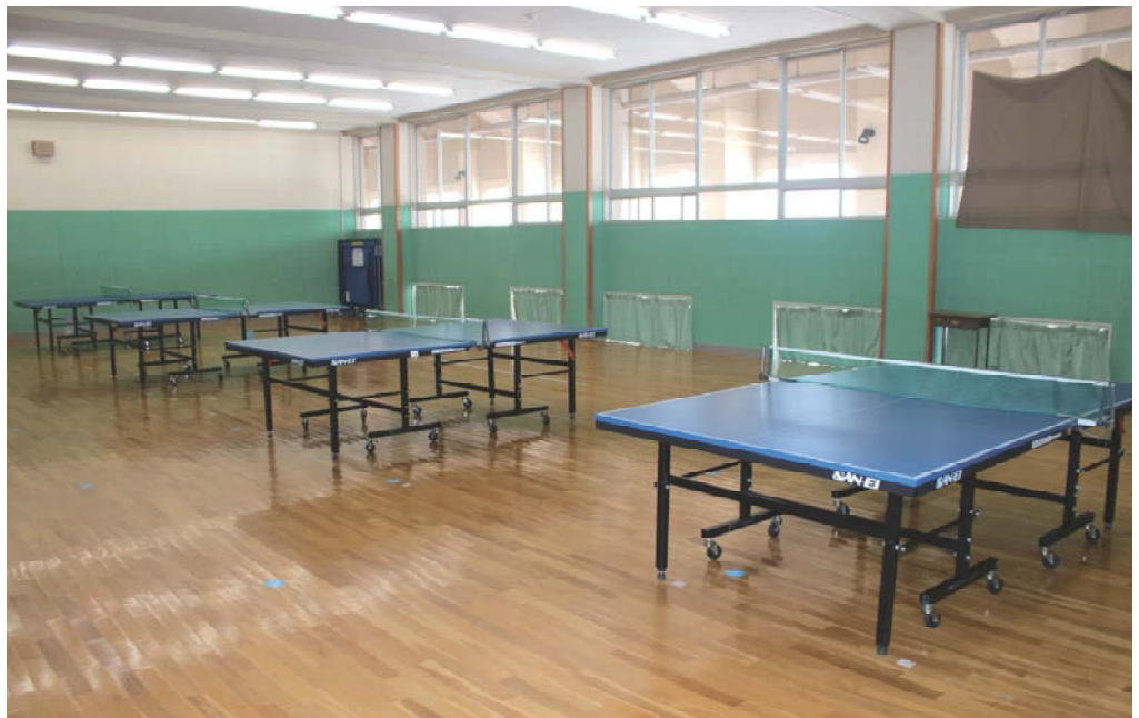
■卓球場（多目的ホール）