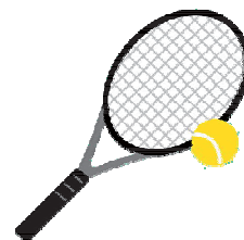
フレッシュテニス