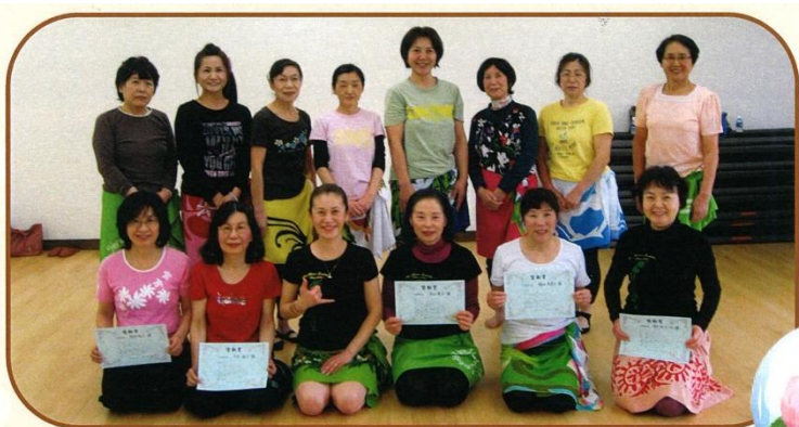
平成25年度3月 南砺市心くみつプール