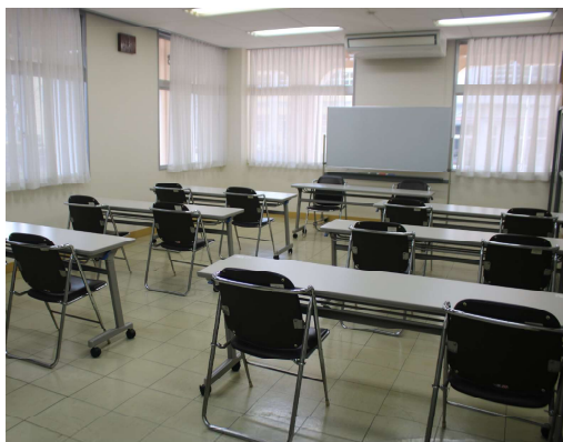
■ 会議室（別途使用料が必要）