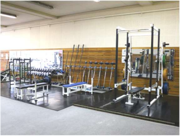
トレーニング室 ・有酸素マシン(トレッドミル・エアロバイク・クライマー・クロストレーナー) ・トレーニングマシン ・フリーウエイト ・振動マシン